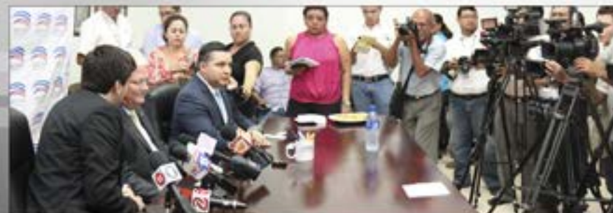
Conferencia de Prensa