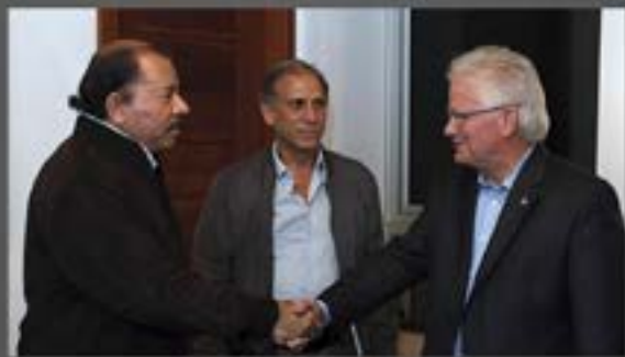
Sr. Daniel Ortega Saavedra Presidente de la República